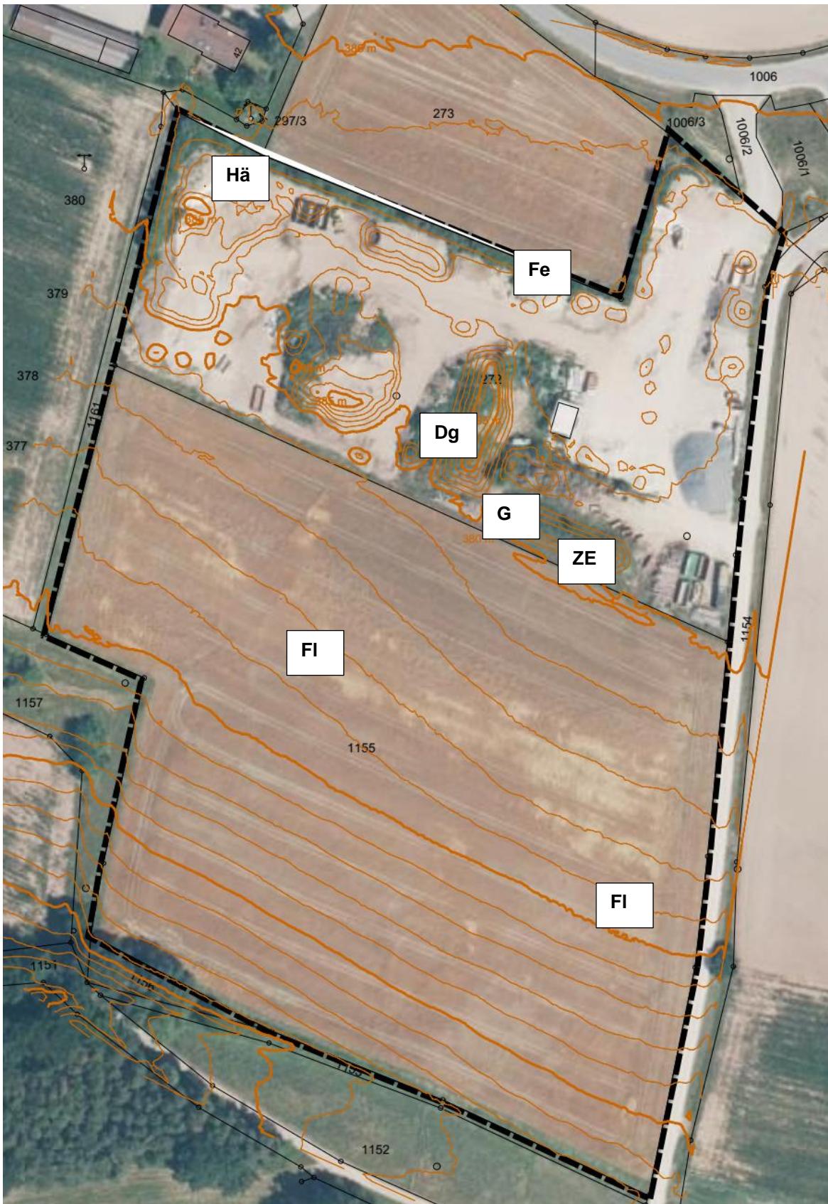
Abbildung 1: Geltungsbereich und Lage von Revieren von Brutvogelarten